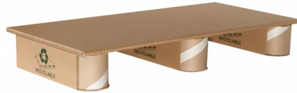
KUITULAVA 1/3E 400 x 800 mm