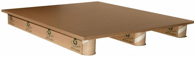
KUITULAVA F 1200 x 1000 mm