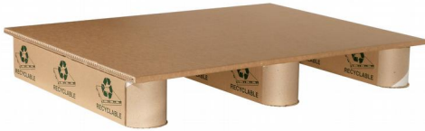
KUITULAVA 1/2E 600 x 800 mm