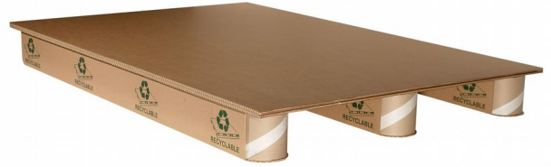
KUITULAVA E 1200 x 800 mm